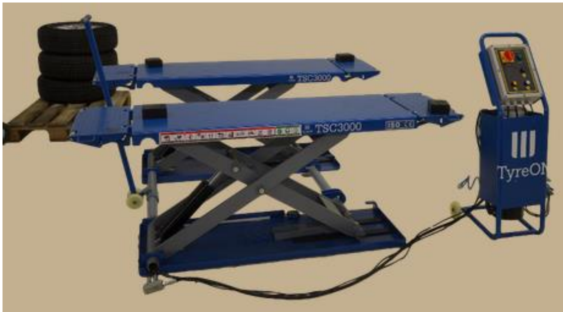
Fig. 1 De TyreON TSC3000 hefbrug